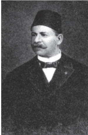
أحمد شكري باشا والد إسماعيل صدقي باشا ... كان وكيلاً لوزارة الداخلية في عهدي إسماعيل وتوفيق.