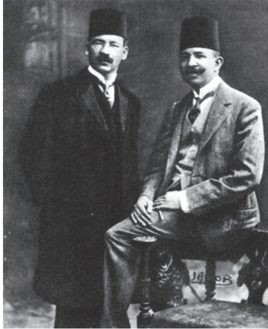
إسماعيل صدقي باشا، وعبد الخالق ثروت باشا بطلا تصريح ٢٨ فبراير سنة ١٩٢٢.

بالغاء الحياة النيابية إغناءً تاماً، أو تعطيلها إلى أجل غير مسمى، حتى تجري الأمور في مجاريها الطبيعية، ويلتفت رجال السياسة إلى مصالح البلاد، ويتعهدوها بالخدمة الخالصة.