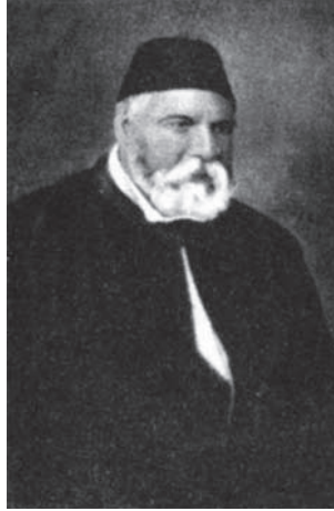
محمد سيد أحمد باشا جد إسماعيل صدقي باشا لوالدته، ورئيس ديوان الأمير محمد سعيد.