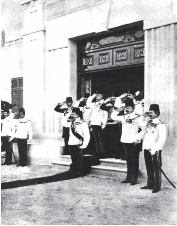
الخدوي عباس خارجًا من سراي الحاكم العام للسودان، حين زيارته للسودان ١٩٠٢.

رأت الحكومة أن أمضي في مفاوضاتي الخاصة بالحدود ما بين إيطاليا ومصر؛ لأنني كنت قد ألمت بأطرافها، بل ذهبت إلى إيطاليا لمقابلة موسوليني بشأنها، فكانت النتيجة في آخر الأمر أن جرى الاتفاق، الذي صورته السياسة الحزبية بصورة سوداء كعادتها. كان هم مصر في هذا الاتفاق أن تحصل على خليج السلوم، وعلى الهضبة التي تعلو السلوم، والمنطقة التي حولها إلى بلدة بردية غربًا، وكان الإيطاليون قد احتلوا هذا المكان الذي يشرف على هذه المدينة المصرية، فكانت هذه المنطقة هي التي تهم مصر؛ لأنها تشرف على أراضيها؛ ولأنها هي الطريق الذي يستطيع أي غاصب أن يدخل منه البلاد