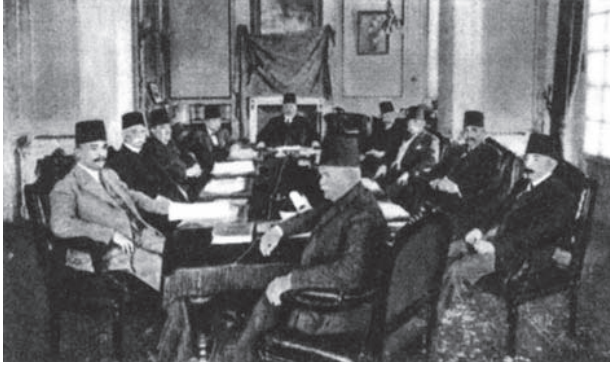
وزارة أحمد زيور باشا أثناء اجتماعها سنة ١٩٢٥ ويرى إسماعيل صدقي باشا إلى يمين رئيس الوزراء.

وإنني شخصياً لا أؤيد فكرة إنشاء اتفاقات تشمل تعهدات سياسية وعسكرية بين مصر، وبلاد جامعة الدول العربية، فإن هذه الجامعة إنما أنشئت في الواقع على أساس رابطة الأخوة بين أعضائها، الناتجة من التشابه في الجنس واللغة والتاريخ المشترك، وموقع البلاد الجغرافي، وهذه الأخوة تعفي الدول المذكورة من الالتزام بأن تبرم بينها معاهدات سياسية أو عسكرية معينة.