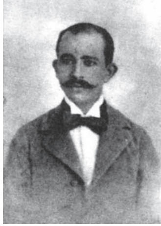
إسماعيل صدقي باشا في سن العشرين ... حينما كان في وظيفة مساعد نيابة في بلدة إيتاي البارود.