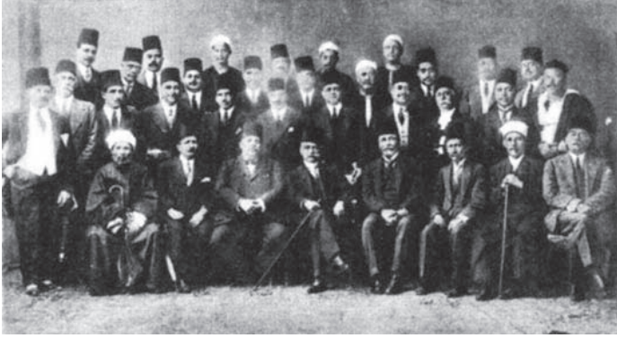
أعضاء لجنة الدستور يتوسطهم حسين رشدي باشا رئيس اللجنة.

ولكن كثيراً من هؤلاء يأبون أن يخوضوا معامع الانتخاب؛ صوناً لكرامتهم عن المنازعات والمناضلات؛ لذلك تفتح لهم في كثير من البلاد أبواب مجلس الشيوخ، وسواء أكان الدخول فيه بطريق التعيين أو بطريق الانتخاب، فإنه لإبعاد مزاحمة طوائف محترفي السياسة، رأيت أن يشترط فيمن يدخله شروط خاصة من الوظائف أو الأعمال، أو الصناعات أو الثروة، وزدت في الدستور نسبة المعينين في هذا المجلس من خمسه إلى ثلاثة أخماسه، فأصبحت نسبة المعينين من الشيوخ أكثر من المنتخبين، حتى لا تحرم البلاد من خدمات عدد من رجالها الأكفاء.