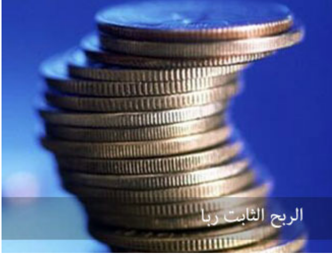
الربح الثابت ربا

الآن: كم من مسلم في هذا البلد مستثمر أمواله بربح ثابت؟ بالألوف، بمئات الألوف، كله حرام، إذا كان الربح ثابتاً فهذا ربا، أخي! أنا لا أدخل في حساباته يخرجني، أنا لي على المئة ألف ألفان في الشهر، ولا يحب أن يدخل بمئات مع الناس، هذا ربا، وعلى هذا ففس مئات الحالات، آلاف الحالات، فالورع أن تدع ما لا بأس به حذراً مما به بأس.