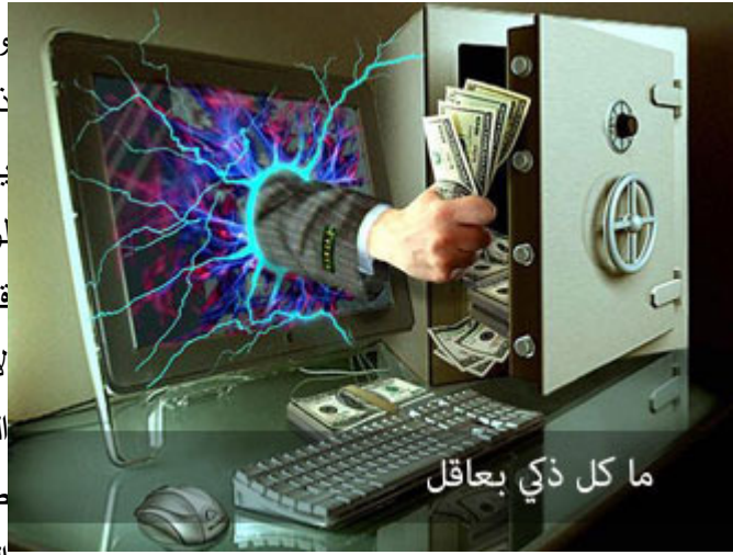
ما كل ذكي بعقل

قال بعض الأعراب: لو صورّ العاقل، لأظلمت معه الشمس المضيئة - أي الشمس أقل تألّقاً من عقل العاقل-، ولو صورّ الأحمق لأضاء معه الليل المظلم، - أي الأحمق أشد ظلمة من