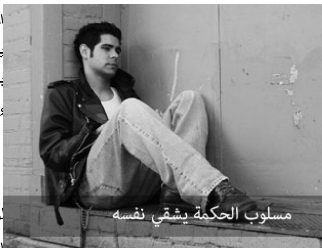
مسلوب الحكمة يشقى نفسه

يمكن لشخص أن يكون بيته جحيماً، وماله نقمة عليه، وقوته سبب دماره، سبب تصرفاته، سبب شقائه، فيجب أن نعتقد أن الحكمة من لوازم المؤمن، هي العطاء الإلهي للمؤمن، هذا المعنى الثاني: الحكمة هي النبوة وقيل: كاد الحكيم أن يكون نبياً، وبعضهم قال: