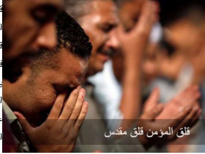
قلق المؤمن قلق مقدس

قضيته مع الله قضية كبيرة، علامة المؤمن أنه قلق، عنده قلق دائم، هذا قلق مقدس، أما بعد أن عرف الله، فيقلقه ألا يكون في المستوى المطلوب. يقولون: سيدنا رسول الله حجب عنه الوحي أسبوعين تقريباً، فقال: يا عائشة، لعلها تمرة أكلتها من تمر الصدقة.