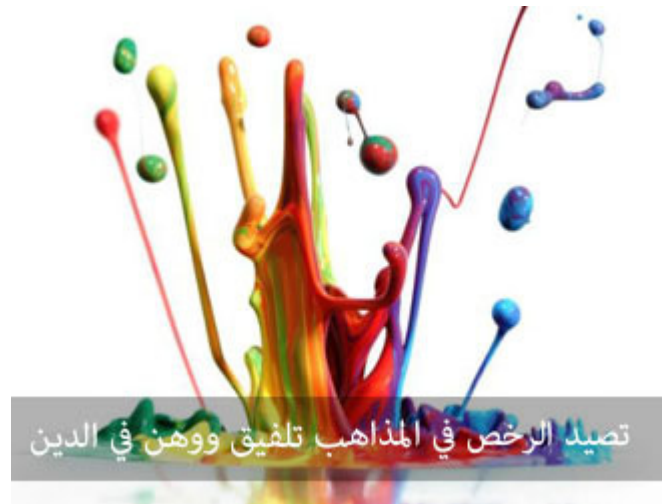
تصيد الرخص في المذاهب تليق ووهن في الدين

هناك ورع وسوسة، هذا غير مطلوب، وهناك ورع حقيقي، وهناك قلة ورع. إذا الإنسان مثلاً أحب أن يأخذ من كل مذهب قليلاً، يجمعهم كلهم، انظروا لي؛ أين لا توجد زكاة في الحلبي؟ أين يوجد كذا؟ أين يوجد كذا؟ تصيد الرخص في كل المذاهب، وقع في شبهة التلفيق والوهن في الدين.