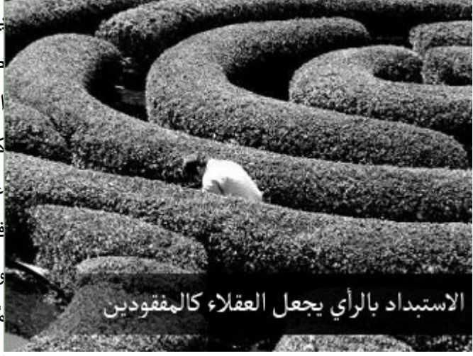
الاستبداد بالرأي يجعل العقلاء كالمفقودين

يقول بعضهم في هذا المجال كلامًا طيبًا: إن الاستبداد في الرأي يجعل العقلاء كالمفقودين، والمختارين كالمكرهين، إذا استبدَّ إنسان برأيه وحوله عقلاء، يلغي عقلهم بهذه الطريقة، فالطريقة المستبدة تلغي عقل العقلاء واختيار المختارين، المختار ينقلب إلى مُضطر، والعاقل ينقلب إلى غبي حينما يستبد برأيه.