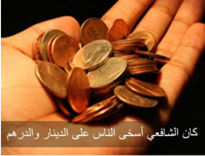
كان الشافعي أسخى الناس على الدينار والدرهم