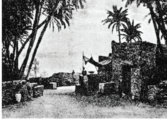
منظر الفصل الثالث: منزل باخ صانع الفخار.