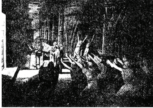
منظر الفصلين الرابع والخامس: معبد آمون بطيبة.