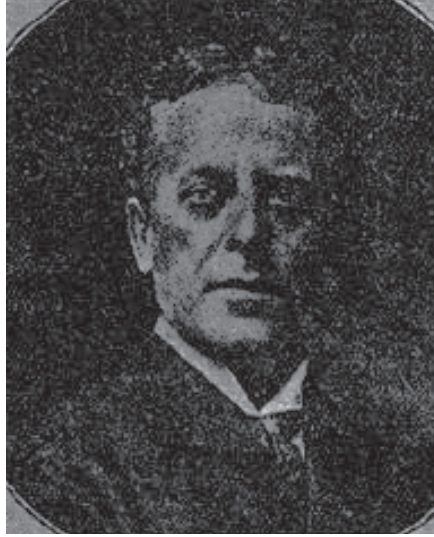
أوجين بريو EUGÈNE BRIEUX «العضو بالأكاديمية الفرنسية ومؤلف الرواية».

وُلد أوجين بريو بباريس سنة ١٨٥٨ واشتغل بالصحافة، وتأليف الروايات التمثيلية، وبدأت شهرته فيها برواية «بلانشيت Blanchette» التي مُثِّلت سنة ١٨٩٢ وأُعيد تمثيلها سنة ١٩٠٣ وفيها أظهر المؤلف خطر التعليم إذا لم يتناسب مع أحوال النفوس والبيئات،