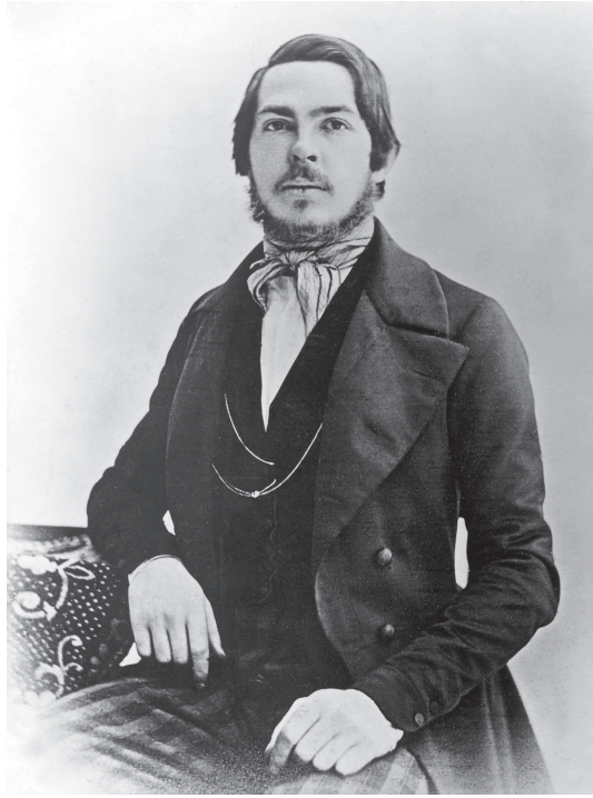
شكل ٤-١: فريدريك إنجلز، عام ١٨٤٥.

كادت مخطوطة كتاب «الأيدولوجية الألمانية» تكون مكتوبة بالكامل بخط يد إنجلز، وكانت التصحيحات والتغييرات بخط كلا المؤلفين. في بعض الأحيان، كانت الصفحات مقسمة إلى عمودين، كان النص على اليسار، والإضافات على اليمين، وكان خط ماركس يكاد لا يُقرأ، وقيل إن إنجلز قد كُلف بعملية كتابة النص الذي اشتركا شفهيًا في تأليفه. كان العمل من الناحية الفلسفية مماثلًا للأعمال السابقة لماركس أكثر مما كان مماثلًا لأعمال إنجلز، وكان القسم الأول مستقى مباشرةً من مقالة ماركس «أطروحات حول فيورباخ»، التي كتبها في أوائل عام ١٨٤٥ قبل وصول إنجلز إلى بروكسل. وفي هذه السطور القليلة، شنَّ ماركس هجومًا على «كافة أشكال المادية السابقة» (الأعمال المجمعة