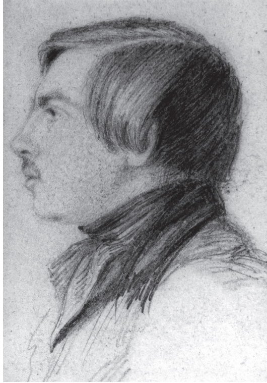
شكل ٢-٢: فريدريك إنجلز في سن التاسعة عشرة.

كانت تأملات جورج فيلهلم فريدريش هيغل عن الوعي والوجود والتاريخ والدولة والدين والطبيعة وغيرها من الموضوعات العديدة التي لا يمكن حصرها؛ تجريديةً إلى حدٍّ كبير. علاوةً على ذلك، فقد كانت بعض كتاباته غامضة؛ فالاستنتاجات التي توصل إليها ربما لم تكن هي الاستنتاجات الوحيدة التي يمكن استنتاجها من تحليلاته الفلسفية — أو ربما لم تكن الاستنتاجات الأوفر حظاً في إمكانية دعمها. وتعارضت فلسفته عن الدين، المتوافقة مع التأويلات الخاصة بمذهب الواحدية، مع تعليقاته المؤيدة للوثنية واعتناقه العلن لها. وبالمثل، فإن دفاعه عن دولة بروسيا لم يكن نتيجةً واضحةً لتفكيره المنطقي