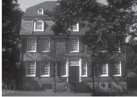
شكل ١-٢: متحف منزل عائلة إنجلز في بارمن (فوربتال حالياً)، ألمانيا، حيث وُلد فريدريك إنجلز عام ١٨٢٠.

والتي توجد تقريباً في كل مكان في ألمانيا»، وكان سبب ذلك هو المصانع (الأعمال المجمعّة لماركس وإنجلز، المجلد الثاني).