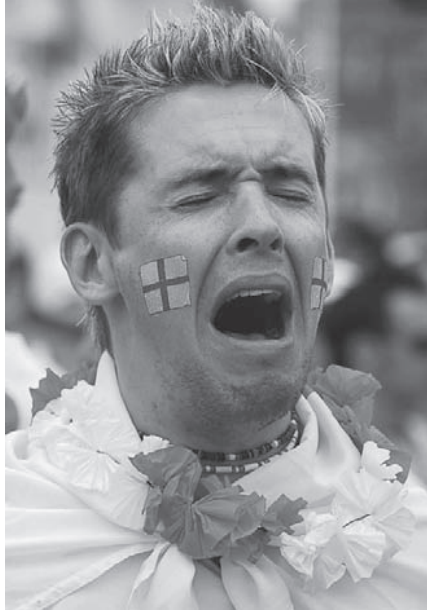
شكل ١-٤: الألم والنشوة: مشجع رياضي.

أصبح علم اللاهوت فاقداً للثقة بفعل تسلل العلمانية إليه، وكذلك بفعل جرائم وحماقات الكنائس. وجاء علم الاجتماع الوضعي وعلم النفس السلوكي — إلى جانب العلوم السياسية الخالية من أي رؤية — ليكملا خيانة النخبة المثقفة. فكلما سُخِّرت العلوم الإنسانية لخدمة احتياجات الاقتصاد، ازداد تخليها عن دراسة وفحص القضايا والمسائل الجوهرية؛ ومن ثم هرع بائعوا بطاقات التاروت، والعرافون، وأفاتارات أتلانتس، ومتخصصو تنقية الروح لشغل مكانها. وهكذا أصبح معنى الحياة صناعة مربحة. وهكذا كانت كتب على شاكلة «الميتافيزيقا للتجار المصرفيين» تُلْتَهَم سريعاً. واتجه الرجال والنساء ممن تحرروا من وهم العالم المهووس بصنع المال والثروة إلى متعهدي الحقيقة الروحانية، الذين كونوا ثروة طائلة من توريدها.