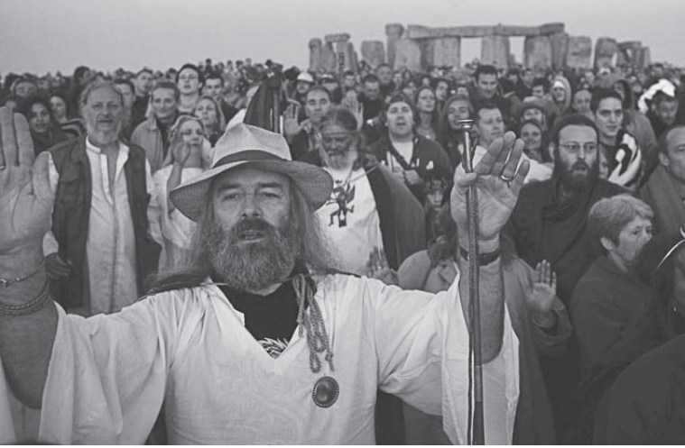
شكل ١-٢: تجمع لحركة «العصر الجديد» في ستونهنج.

في غضون ذلك، كلما لاح الدين كبديل للنزيف المستمر للمعنى العام، كان يُدفع في اتجاه أشكال قبيحة متعددة من الأصولية. أو إن لم يكن ذلك، كان يدفع في اتجاه هراء أنصار حركة العصر الجديد. باختصار أصبحت الروحانية إما جامدة أو فاترة بلا روح. ومن ثم أصبحت مسألة معنى الحياة بين أيدي المرشدين الدينيين والموجهين الروحانيين، والمتخصصين في خلق الإحساس بالسعادة، ومعالجي النفس. ومن خلال التقنيات الصحيحة، كان يمكنك أن تضمن نفض غبار انعدام المعنى عنك في غضون فترة بسيطة لا تتجاوز الشهر. واتجه المشاهير الذين فسدت عقولهم بفعل المداهنة إلى الكابالا والساينتولوجي. وكان مصدر إلهامهم في هذا هو ذلك الاعتقاد الخاطيء والتافه بأن الروحانية لا بد بالطبع أن تكون شيئاً دخلياً وسرياً، وليس شيئاً عملياً ومادياً. وفي نهاية المطاف، كانت المادة — في شكل الطائرات الخاصة ومجموعات الحرس الخاص — هي ما كانوا يحاولون — على الأقل ذهنيًا — الهروب منها.