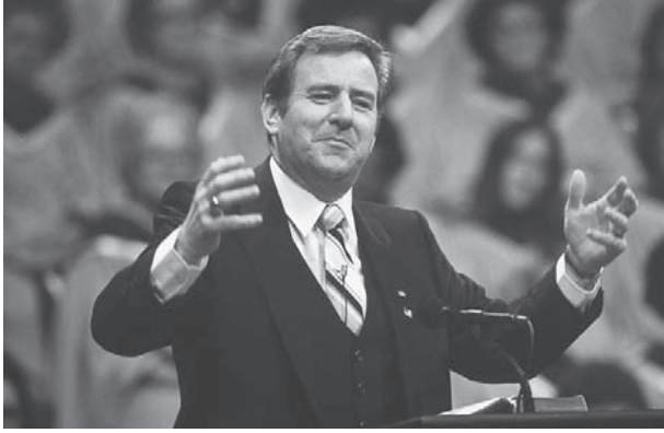
شكل ١-٣: المبشر التلفزيوني الأمريكي جيري فالويل في عرض أصولي حماسي مكتمل.

قرون على استعداد للتضحية بأرواحهم في سبيلها. فالرياضة تتضمن ولاءات وعداوات قبلية، وطقوساً رمزية، وأساطير رائعة، وأبطالاً رموزاً، ومعارك ملحمية، وجمالاً حسيّاً، وإشباعاً بدنيّاً، وإشباعاً فكريّاً، واستعراضات مهيبية، وإحساساً عميقاً بالانتماء. كذلك تقدم التضامن الإنساني والتجسيد اللحظي للذين لا يوفرهما التليفزيون. ولولا هذه القيم، لصارت حياة الكثيرين خاوية بلا شك. فالرياضة — وليس الدين — هي أفيون الشعوب الآن. والحق أن الدين الآن في عالم الأصولية الإسلامية والمسيحية لم يعد أفيون الشعوب بقدر ما هو كوكاين الشعوب.