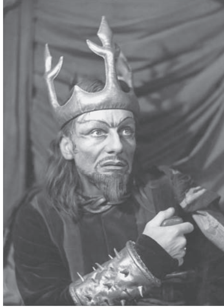
شكل ١-٢: جون جيلجود في دور ماكبث مذعورًا.

وماذا عن عبارة «إنها حكاية يرويها أحمق»؟ تعد هذه العبارة — من جانب ما — عبارة عزاء ومواساة. فقد تكون الحياة حمقاء وسخيفة، ولكنها على الأقل تشكل قصة تتضمن بنية أولية غير متطورة من نوع ما. قد تكون محرفة ومنقوصة، ولكن هناك راوٍ وراءها، حتى وإن كان راويًا أحمق. في إنتاج تلفزيوني لمحطة بي بي سي للمسرحية قبل بضع سنوات، لم يُلقِ الممثل الذي يؤدي دور ماكبث هذه السطور الختامية بتمتمة متقطعة، وإنما ألقاها في دفقة غاضبة من الاستياء، صارخًا بها في غضب عارم أمام كاميرا رأسية قصد بها بشكل واضح أن تحل محل الإله. لقد كان الإله هو ذلك الراوي الأحمق. وكما هو الحال بالنسبة لرؤية شوبنهاور للعالم والتي سنتناولها هاهنا، كان هناك بالفعل مؤلف لهذه المسرحية الهزلية الرهيبة، ولكن ذلك لم يكن يعني أنها مفهومة. على العكس، فقد أضفى ذلك لمحة مقززة من السخرية على سخافتها ولا معقوليتها. غير أن ثمة غموضًا هنا: هل الحكاية تافهة بطبيعتها، أم أنها تافهة لأن