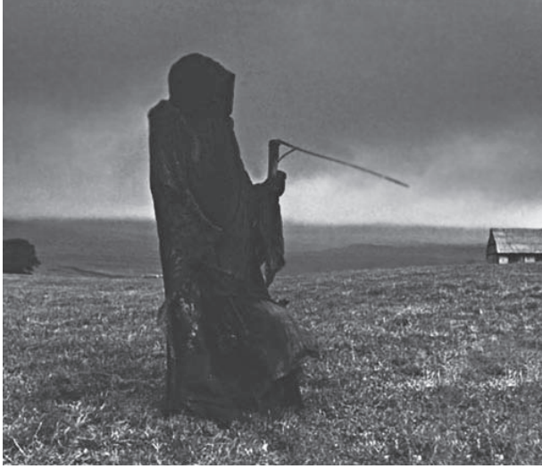
شكل ٤-٢: قابض الأرواح: لقطة ساكنة من فيلم «معنى الحياة» لمونتي بايثون.

بدأ فرويد رحلته بالاعتقاد بأن معنى الحياة هو الرغبة، أو خدع اللاوعي خلال فترة اليقظة من حياتنا، وتوصل للاعتقاد بأن الموت هو معنى الحياة. ولكن هذا الادعاء يمكن أن يكون له عدة معانٍ مختلفة. فهو يعني لدى فرويد نفسه أننا جميعاً في النهاية عبيد لدى «ثاناتوس» أو غريزة الموت. ولكنه يمكن أن يعني أيضاً أن الحياة التي لا تحوي شيئاً، لدى الفرد الاستعداد للموت في سبيله، من غير المحتمل أن تكون مثمرة. أو يمكن أن يشير إلى أن الحياة في ظل الوعي بفنائيتنا يعني العيش بالواقعية والسخرية والمصادقية وإحساس تأنيبي بمحدوديتنا وضعفنا. وعلى هذا الصعيد على الأقل، فإن التمسك بإيماننا بأكثر ما هو حيواني فينا يعني العيش بمصادقية. فسوف نكون أقل ميلاً لخوض مشروعات متغطرة تجلب الأسى لنا وللآخرين. فالثقة اللاواعية في خلودنا هي مصدر جزء كبير من دمارنا.