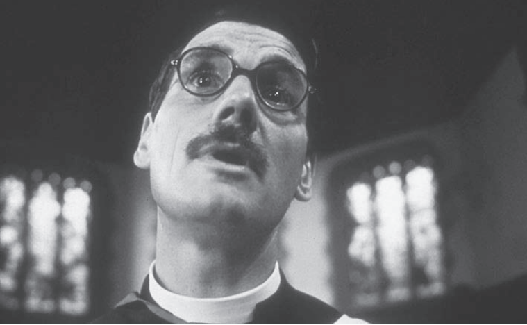
شكل ١-٥: مايكل بالين في دور قس أنجليكاني متملق في فيلم «معنى الحياة» لفريق مونتي بايثون.

غير أنه من المحتمل أن يشكك الكثيرون من قراء هذا الكتاب في عبارة «معنى الحياة» مثلما يشككون في وجود بابا نويل. فهو يبدو كمفهوم من نوع غريب، يتسم بالبساطة والروعة في الوقت ذاته، ويصلح للخضوع للانتقاد التهكمي لفريق مونتي بايثون. 8 ويعتقد عدد كبير من المثقفين في الغرب اليوم — على الأقل خارج نطاق الولايات المتحدة المتدينة بصورة تثير الدهشة — أن الحياة عبارة عن ظاهرة تطورية عارضة ليس لها معنى متأصل أكثر من تقلب هوائي أو قعقعة في المعدة. غير أن حقيقة أنها ليس لها معنى محدد تمهد الطريق للأفراد من الرجال والنساء لتكوين أي معنى يمكنهم تكوينه لها. وإذا كان لحياتنا معنى، فإنه شيء يمكننا من خلاله استثمار هذه الحياة، وليس شيئاً تأتي مجهزة به.