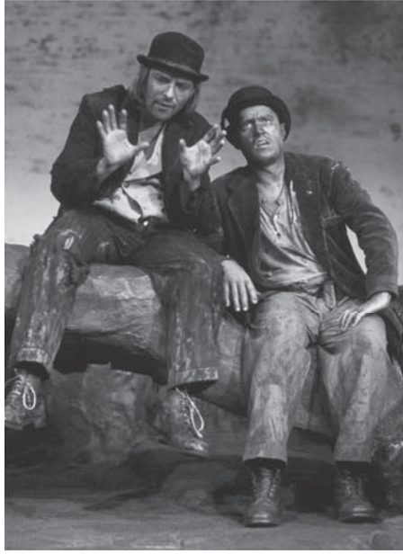
شكل ٣-١: فلاديمير واستراجون في مشهد من مسرحية صمويل بيكيت «في انتظار جودو».

إذا كان العالم مبهمًا، فإن اليأس غير ممكن. فواقع غامض لا بد بالتأكيد أن يترك مجالاً للأمل. ولعل ذلك أحد أسباب عدم إقدام المتشردين (ولكن من قال إنهم متشردون؟) على قتل أنفسهم. فلا وجود للموت في أدب بيكيت، فقط عملية لا تنتهي من الانحدار والتدهور الجسدي؛ من تيبس الأطراف، وتشقق الجلد، وتشوش مقلة العين، وثقل السمع، وهو تدهور يبدو أنه سيستمر للأبد على الأرجح. ويبدو أن غياب جودو قد غمر الحياة في حالة من الغموض المتطرف، ولكن هذا يعني أنه لا يوجد تأكيد على أنه لن يأتي. فإذا كان كل شيء مبهم وغامض، فلا بد أن هذا يسري أيضًا على معرفتنا به، وفي هذه الحالة لا يمكننا استبعاد احتمالية وجود حبكة سرية وراء كل ذلك. حتى الكآبة لا يمكن أن تكون مطلقة في عالم بلا ثوابت مطلقة. فيبدو أنه لا يمكن أن يكون هناك خلاص في عالم من هذا النوع، رغم أنه يبدو لنا أنه المكان الذي قد لا تزال فيه