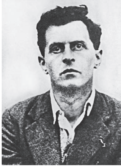
شكل ١-١: لودفيج فيتجنشتاين، الذي يعتبره الكثيرون أعظم فلاسفة القرن العشرين.

لعبارة «لدي ألم»، ليس فقط بطريقة تلقي الضوء على استخدام الضمائر الشخصية مثل «أنا» و«هو»، وإنما أيضًا بطرق تقوض الافتراض القديم الراسخ بأن خبراتي هي نوع من الملكية الخاصة. بل إنها في الواقع تبدو كملكية خاصة ربما أكثر من قبعتي؛ إذ إن بإمكانني إهداء قبعتي للغير، ولكن ليس ألمي. ويوضح لنا فيتجنشتاين كيف أن القواعد اللغوية تخدمنا بدفعنا نحو التفكير بهذا الأسلوب، ولحجته تبعات متطرفة، بل تبعات متطرفة سياسياً.