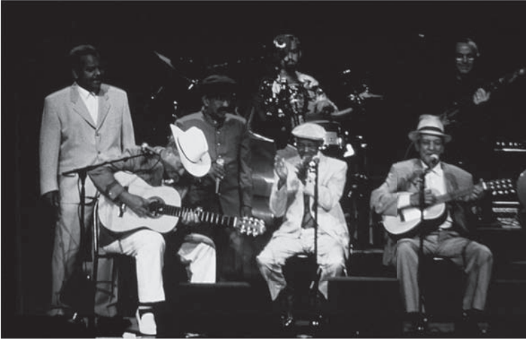
شكل ٤-٤: فريق بوينا فيستا سوشيال كلوب.

إبداعية وديناميكية وناجحة ومكتملة، ولكنها تتألف من تعذيب الآخرين أو سحقهم. وبناء على هذه النظرية أيضًا، فإن الفرد ليس مرغماً على الاختيار بين عدد من المرشحين المختلفين من أجل تحقيق الحياة الجيدة، مثلما يشير جوليان باجيني إلى حتمية هذا الاختيار. فيقدم باجيني مجموعة من الاحتمالات لمعنى الحياة – السعادة والإيثار والحب والإنجاز وفقدان أو نكران الذات والمتعة والخير الأصح للنوع – ويشير بأسلوبه المتحرر إلى وجود قدر من الحقيقة فيها جميعاً. ومن هذا المنطلق يُقترح نموذج للاختيار والمزج. وهكذا على طريقة المصممين، يمكن لكل منا أن يأخذ ما يريد من هذه العناصر المتنوعة ويمزجها مكوناً منها حياة ملائمة له بشكل متفرد.