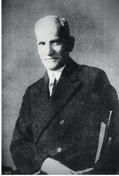
حضرة صاحب السعادة أسعد ياسيني باشا.